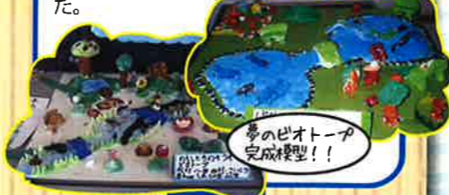
わたしたちのせうめい ビオトープ