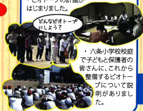
どんなビオトープにしよう?

・地域の皆さんや関係者で「六条小ビオトープ建設委員会」を設立しました。 ・ビオトープの計画がはじまりました。