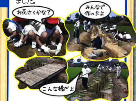
お花さくかな? みんなで作ったよ

・六条幼・小学校の子どもが植物用の土の鉢を製作し、種をまいて水路に設置しました。