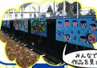
みんなで描いた作品を見てね

・六条幼・小学校の子どもが夏休みを利用して各地区ごとに、親子みんなで手書きの絵看板を製作し「さくらの道」沿いに設置しました。