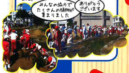
みんなの協力でたくさんの植物が集まりました

・六条幼・小学校の子どもが持ち寄り、地域の皆さんに寄付していただいた植物を「青空のおか」に沿って植えました。