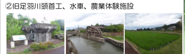
②旧足羽川頭首工、水車、農業体験施設 (見どころ) ・旧足羽川堰堤の保存施設と当時の位置 ・三連水車、農業体験施設