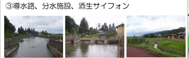
③導水路、分水施設、酒生サイフォン (見どころ) ・導水路、沈砂池、最初の分水地点 ・サイフォン入口・出口