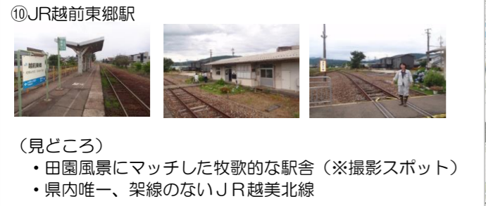
⑩JR越前東郷駅 (見どころ) ・田園風景にマッチした牧歌的な駅舎（※撮影スポット） ・県内唯一、架線の無いJR越美北線