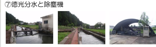
⑦徳光分水と除塵機 (見どころ) ・各路線の水路高の違い、用水路への排水流入のわけ ・除塵機の可動状況、集塵の中身