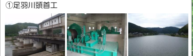
①足羽川頭首工 (見どころ) ・取水の合口、建屋内見学、川面からの眺望