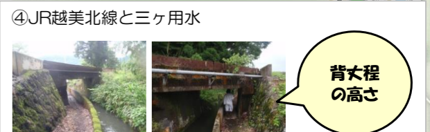
④JR越美北線と三ヶ用水 (見どころ) ・越美北線橋梁下の通り抜け（※撮影スポット）