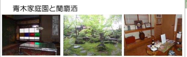
青木家庭園と蘭麴酒 (見どころ) ・江戸時代建造の休憩室・鶴亀庭園の見学