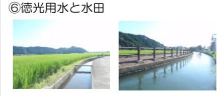
⑥徳光用水と水田 (見どころ) ・水路・水田・里山のパノラマ景観