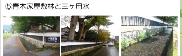
⑤青木家屋敷林と三ヶ用水 (見どころ) ・青木家の大樫と三ヶ用水の景観 ・三ヶ用水の水音（青木家前の水路のみ体感可）