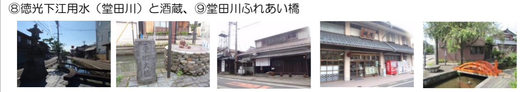
⑧徳光下江用水（堂田川）と酒蔵、⑨堂田川ふれあい橋 (見どころ) ・用水を核とした街並み景観 ・地元酒蔵（安本酒造、毛利酒造） ・堂田川ふれあい橋