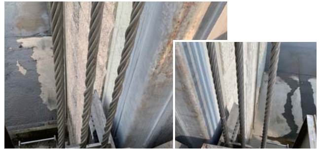
より戻りがみられるワイヤーロープ

※負担額の半額を借入れ、残りを積立金で充当します。 負担金は10a当たり約104円で、令和5年度から令和9年度まで徴収します。